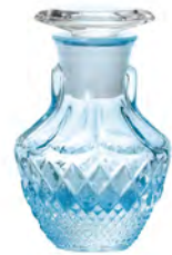
無鉛水晶 DF-71646 Ø57高87mm 容65cc 3x32/件