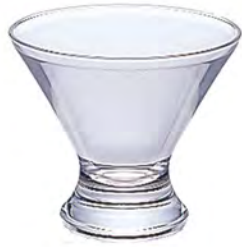
口部強化 DB-6732 Ø102高92mm 容210cc 6x8/件 強化寬口甜點杯