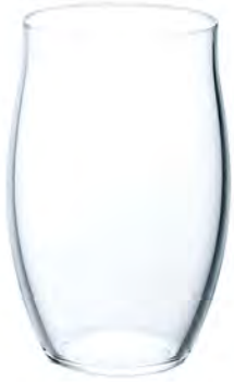
全面イオン強化 DL-6704 Ø74高115mm 容360cc 3x24/件