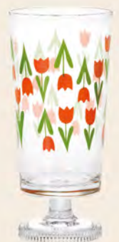
D1901 Ø73高156mm 容305cc 1x30/件 昭和鬱金香