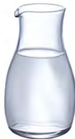
DB-2204 Ø77xH129mm 290cc 3x12/件 手仿陶倒酒瓶