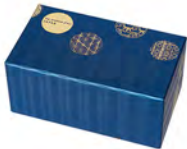
DS-6211 Ø88高92mm 容345cc 1x18/件 丸紋對杯組