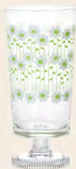
D1904 Ø73高156mm 容305cc 1x30/件 昭和狂想曲