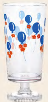
D1902 Ø73高156mm 容305cc 1x30/件 昭和氣球