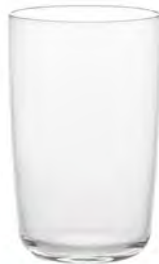
口部イオン強化 DB-6781 Ø64高100mm 容245cc 1x60/件