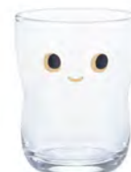
口部強化 D1829 Ø60高75mm 容130cc 1x30/件