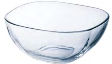
DP-6327 Ø165xH73mm 3x8/件 日式調理鉢