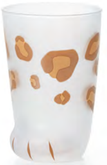
D6046 Ø75高110mm 容300cc 1x36/件