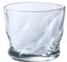
DB-6888 Ø66xH54mm 100cc 6x12/件 手仿陶清酒杯