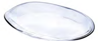
DP-6283 Ø104xH154mm 3x16/件 手仿陶小菜皿