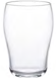
口部イオン強化 DB-6783 Ø63高100mm 容255cc 1x60/件