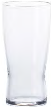
全面イオン強化 DB-6769 Ø64xH127mm 255cc 3x24/件 強化薄吹啤酒杯 S