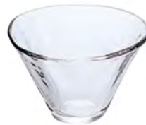
DP-6258 Ø104xH68mm 3x16/件 手仿陶點心盅