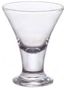
口部強化 DB-6722 Ø91高110mm 容170cc 6x10/件 強化寬口杯