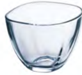
DP-6325 Ø72xH57mm 6x8/件 日式調理鉢