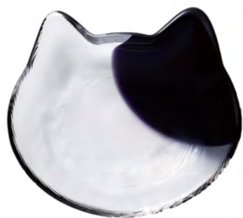
DF-79709 Ø128x110mm 1x36/件 乳牛貓