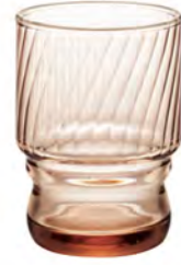
口部強化 DBC-707 Ø67高95mm 容235cc 6x18/件