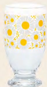
D1860 Ø72高133mm 容335cc 1x30/件 昭和黃菊