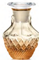
無鉛水晶 DF-71643 Ø57高87mm 容65cc 3x32/件