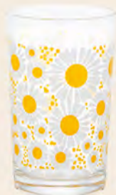
D1865 Ø64高100mm 容200cc 1x30/件 昭和黃菊