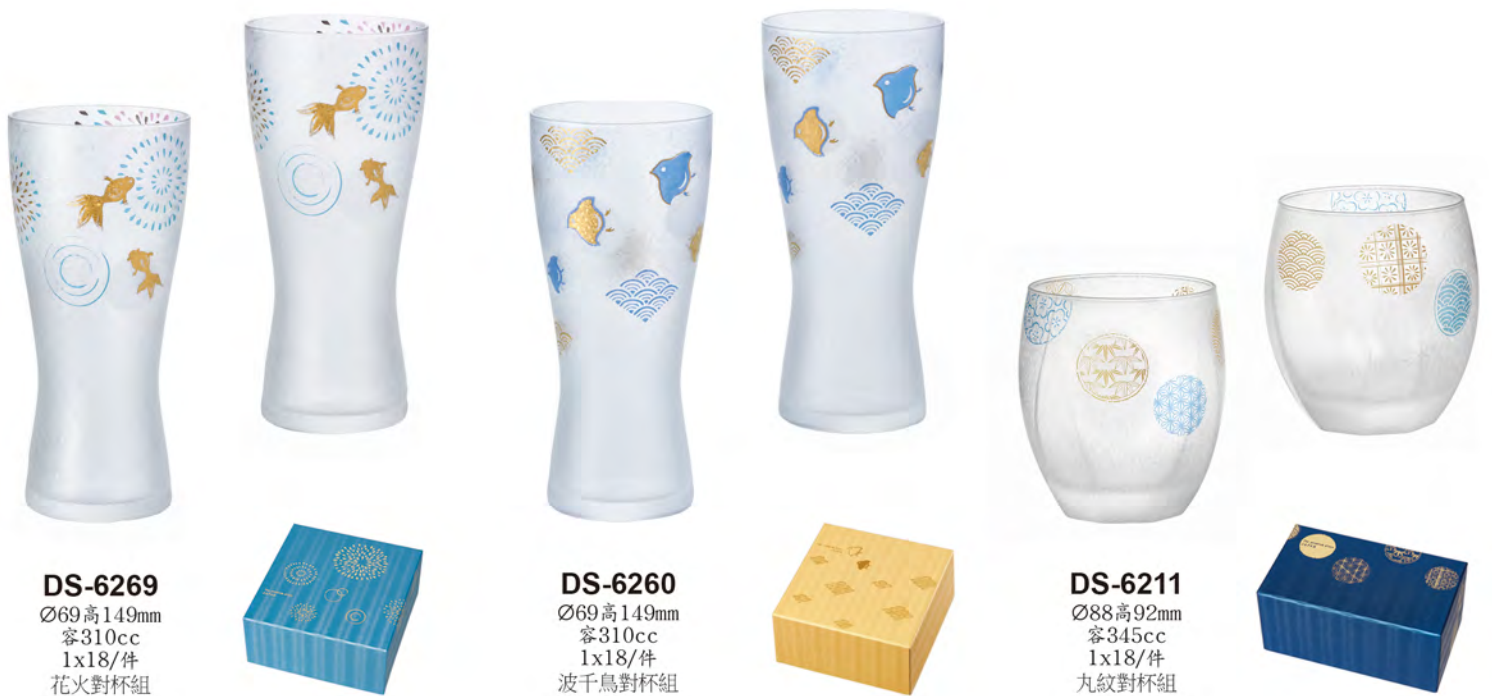
DS-6269 Ø69高149mm 容310cc 1x18/件 火花對杯組