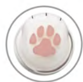
底面にはピンクの肉球