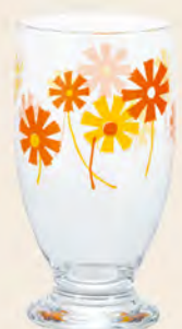
D1857 Ø72高133mm 容335cc 1x30/件 昭和雛菊