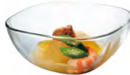
DP-6285 Ø110xH48mm 6x8/件 日式調理鉢