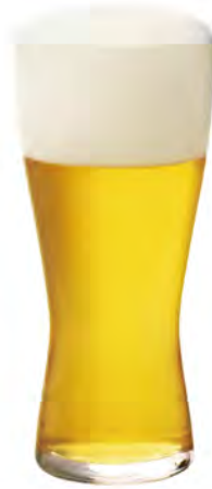
全面イオン強化 DB-6770 Ø69xH149mm 310cc 3x16/件 強化薄吹啤酒杯 M