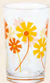
D1862 Ø64高100mm 容200cc 1x30/件 昭和橘菊