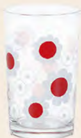
D1864 Ø64高100mm 容200cc 1x30/件 昭和紅花