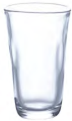
DP-6691 Ø67xH107mm 160cc 3x16/件 手仿陶水杯