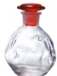
無鉛水晶 DNT 7002R Ø73xH101mm 145cc 6x12/件 日式晶礦紅調味瓶