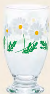
D1858 Ø72高133mm 容335cc 1x30/件 昭和雛菊