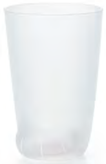
D6045 Ø75高110mm 容300cc 1x36/件