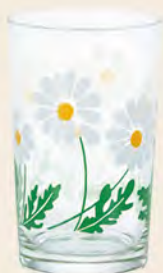
D1863 Ø64高100mm 容200cc 1x30/件 昭和雛菊