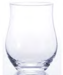
DB-5427 Ø71高90mm 容220cc 3x20/件 聞香杯