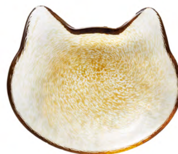
DF-79708 Ø128x110mm 1x36/件 橘貓