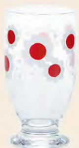
D1859 Ø72高133mm 容335cc 1x30/件 昭和紅花