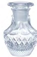
無鉛水晶 DNT208 Ø57高87mm 容65cc 3x32/件