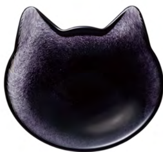
DF-79707 Ø128x110mm 1x36/件 黑貓