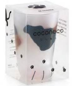
中身が見える クリアパッケージ