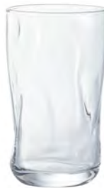
DB-6891 Ø77xH128mm 380cc 3x16/件 手仿陶飲料杯