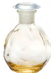
無鉛水晶 DF-49617 Ø73xH101mm 145cc 1x72/件 日式晶礦黃調味瓶