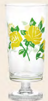
D1903 Ø73高156mm 容305cc 1x30/件 昭和黃玫瑰