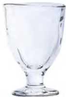
DP-6698 Ø60xH85mm 75cc 3x16/件 手仿陶高腳烈酒杯