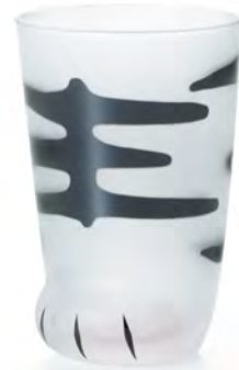
D6047 Ø75高110mm 容300cc 1x36/件