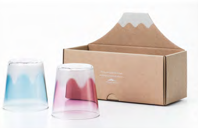
DS-6121 Ø83高85mm 容300cc 1x20/件 富士山對杯組