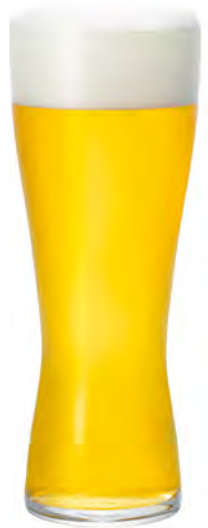
全面イオン強化 DB-6771 Ø73高185mm 容415cc 3x16/件