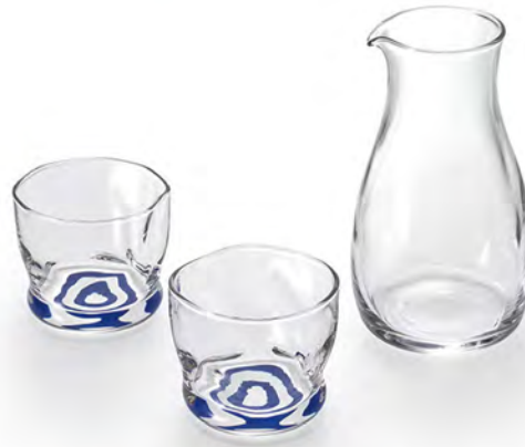
蛇目清酒杯 Ø66xH54mm 100cc 手仿陶倒酒瓶 Ø77xH129mm 290cc