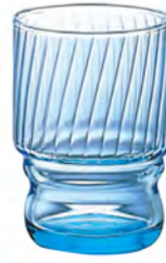
口部強化 DC-648 Ø67高95mm 容235cc 6x18/件