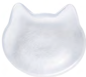
DF-79706 Ø128x110mm 1x36/件 白貓

日本青森縣職人工匠手工製作的玻璃器皿，以療癒的胖胖貓臉為造型設計，隨時隨地將貓咪的慵懶可愛帶到你身邊，無論是放上心愛的點心，還是作為飾品碟，白貓、黑貓、茶貓、橘貓還是乳牛貓，都能帶給你滿滿的愉悅～