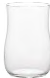
口部イオン強化 DB-6782 Ø70高100mm 容280cc 1x60/件