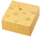
DS-6260 Ø69高149mm 容310cc 1x18/件 波千鳥對杯組