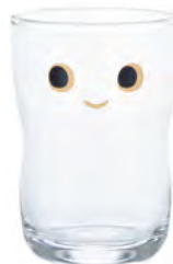
口部強化 D1830 Ø64高93mm 容185cc 1x30/件