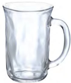
DP-6693 Ø82xH120mm 310cc 3x16/件 手仿陶附柄啤酒杯