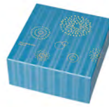
DS-6269 Ø69高149mm 容310cc 1x18/件 花火對杯組