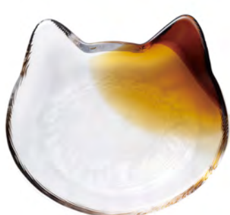
DF-79710 Ø128x110mm 1x36/件 茶貓