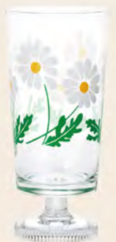
D1900 Ø73高156mm 容305cc 1x30/件 昭和雛菊