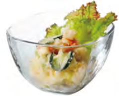
DP-6326 Ø98xH62mm 6x8/件 日式調理鉢