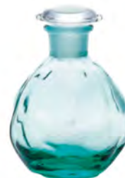
無鉛水晶 DF-49618 Ø73xH101mm 145cc 1x72/件 日式晶礦綠調味瓶