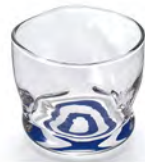
DB-6888H Ø66高54mm 容100cc 6x12/件 蛇目清酒杯

蛇の目模様 圓滑的杯身搭配杯底藍色雙圓，酷似蟒蛇眼睛，因而名為蛇目杯。 蛇目杯用於品酒，藉由杯底雙圓的藍白交接處，來辨識清酒的清濁與色澤。