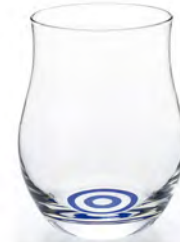
DB-5427H Ø71高90mm 容220cc 3x20/件 蛇目聞香杯